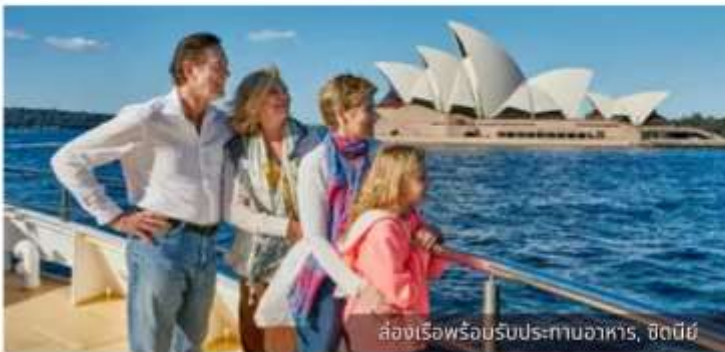
ล่องเรือพร้อมรับประทานอาหาร, ซิดนีย์