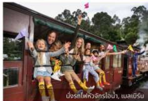
นั่งรถไฟหัวจักรไอน้ำ, เมลเบิร์น