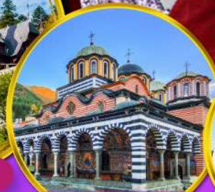
อารามมรดกโลกริล่า