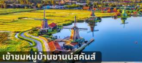
เข้าชมหมู่บ้านชานีส์คันส์