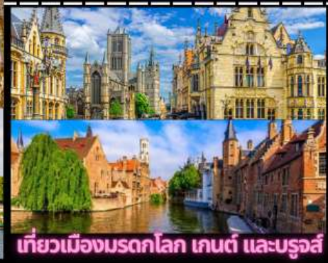
เที่ยวเมืองมรดกโลก เกนต์ และบรูจส์