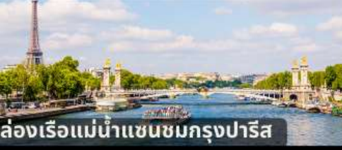
ล่องเรือแม่น้ำแซนชมกรุงปารีส