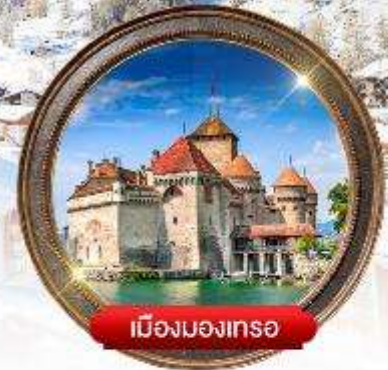
เมืองมงเทรซ