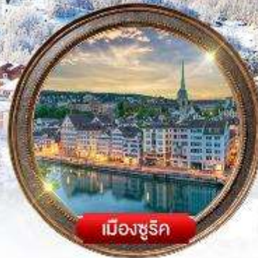
เมืองซูริก