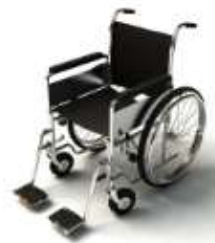
การรับการดูแลเป็นพิเศษ

กรณีผู้เดินทางต้องการความช่วยเหลือเป็นพิเศษ อาทิเช่น การใช้วีลแชร์ กรุณาแจ้งบริษัทฯ อย่างน้อย 7 วันก่อนการเดินทาง มิฉะนั้นบริษัทฯ จะไม่สามารถจัดการล่วงหน้าได้ เนื่องจากการขอวีลแชร์ในสนามบินนั้น ต้องมีขั้นตอนในการขอล่วงหน้า และบางสายการบินอาจมีการเรียกเก็บค่าใช้จ่ายทั้งทางสนามบินในไทยและในต่างประเทศ ซึ่งผู้เดินทางสามารถสอบถามกับเจ้าหน้าที่ได้โดยตรงก่อนทำการจอง และหากในคณะของท่านมีผู้ต้องการดูแลพิเศษ เช่น ผู้ที่นั่งรถเข็น (Wheelchair), เด็ก, ผู้สูงอายุและผู้ที่มีโรคประจำตัวหรือไม่สะดวกในการเดินทางท่องเที่ยวในระยะเวลาเกินกว่า 4 - 5 ชั่วโมงติดต่อกัน ท่านและครอบครัวต้องให้การดูแลสมาชิกภายในครอบครัวของตนเอง เนื่องจากการเดินทางเป็นหมู่คณะ หัวหน้าทัวร์มีความจำเป็นต้องดูแลคณะทัวร์ทั้งหมด