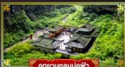
อุทยานหลุมฟ้า

"ฉงชิ่ง" มหานครสุดอลัง เมืองมรดกโลก อุทยานแห่งชาติหลุมฟ้า 3 สะพานสวรรค์