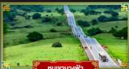
หุบเขานางฟ้า