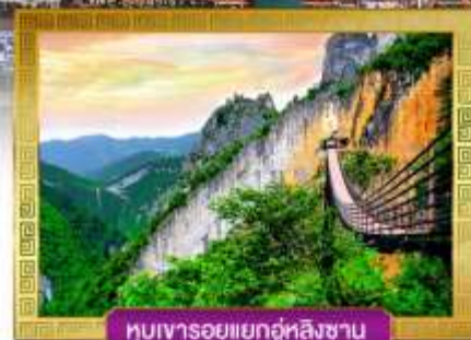
หุบเขารอยแยกอู่หลิงซาน