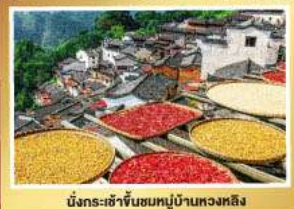
นังกระซำชั้นหมู่บ้านหวงหลิง