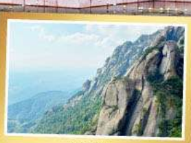
เขาหลิงซาน