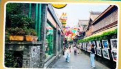
ถนนโบราณชอยกวางชอยแคบ