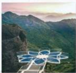
สะพานบัวสวรรค์