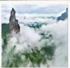
อุทยานเส้นเซียนจวี