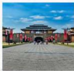
Hengdian World Studio