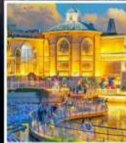
ห้าง SOLANA CENTER