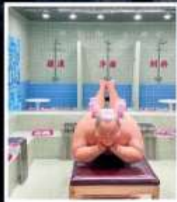
คาเฟ่ย้อนยุคเหอผิง