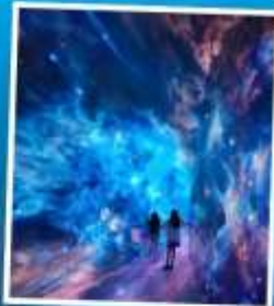
SPACE & TIME CUBE