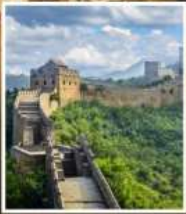
กำแพงเมืองจีน จีหยงกวน