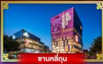
ซานหลี่กุน