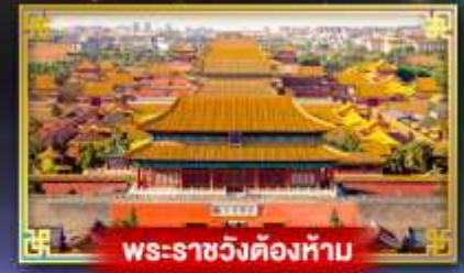
พระราชวังต้องห้าม