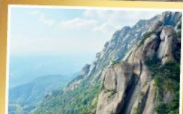
เทามิ่งซาน