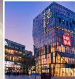
ย่านซานหลี่ถุน