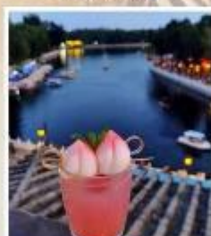
TANG FANG CAFE