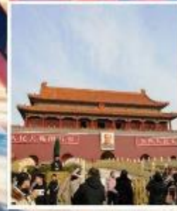
จัตุรัส เทียนอันเหมิน