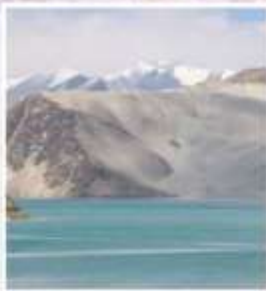
ทะเลสาบไปซาหุ