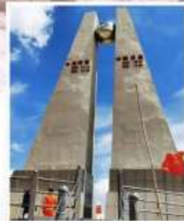
อนุสาวรีย์สุดเขตตะวันตกจีน