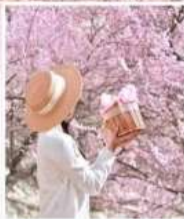
ชมดอกแอปเปิ้ลคอต หมู่บ้านตาเอ่อ