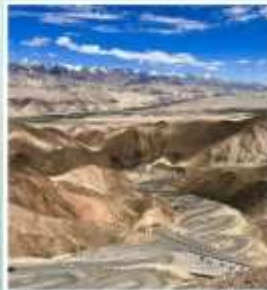
ถนนโบราณผานหลง