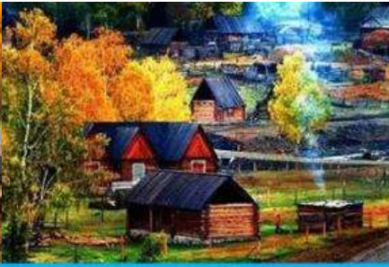
บ้านชนเผ่าถูหว่า