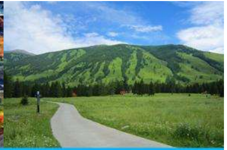
อุทยานคาบาสือ