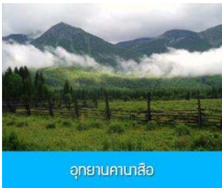
อุทยานคาบาสือ