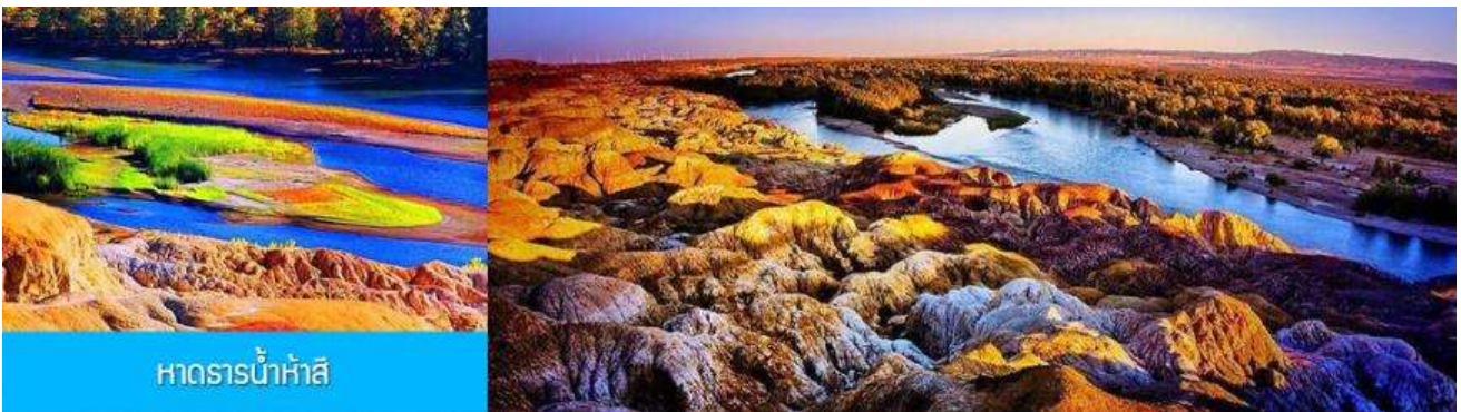
หาดธารน้ำห้าสี