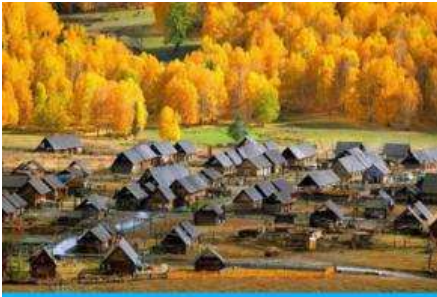
หมู่บ้านเหมอมู่ซุน