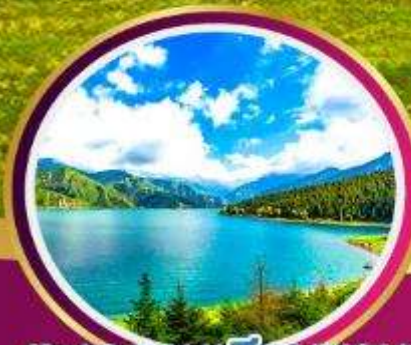
ทะเลสาบเทียนชาน