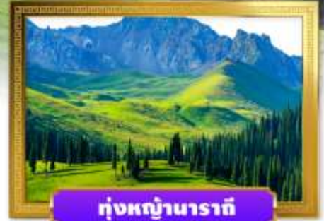
หุบภูน้ำราตี