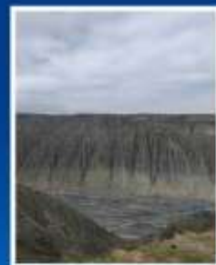
แกรนด์แคนยอน ตู้ซานจื่อ