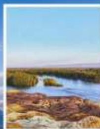
ธารน้ำ 5 สี