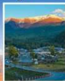
หมู่บ้านไปฮาปา