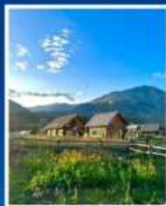
หมู่บ้านเหม่อผู้ซุน