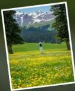
ทุ่งหญ้านาราตี

รับฟรี!! AIG ประกันสุขภาพ และ อุบัติเหตุ 2 ล้านบาท