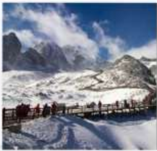
ภูเขาหิมะมังกรหยก