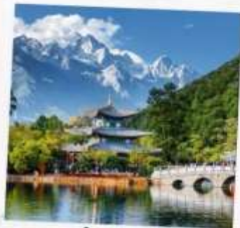
สระน้ำมังกรดำ