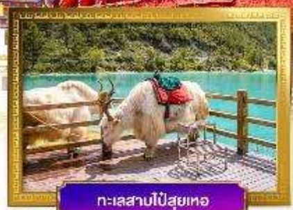
ทะเลสาบไป๋สุ่ยเหอ