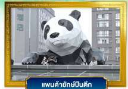
แพนด้ายักษ์ปิ่นตึก