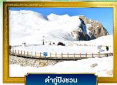
คำตู้ปิงซวน

ช้อปปิ้งจุดถนนคนเดินชุนซีลู่, ถนนไท่กู่หลี่