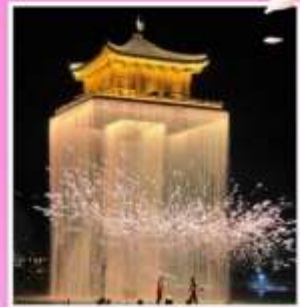
อุ๊นวีโจว