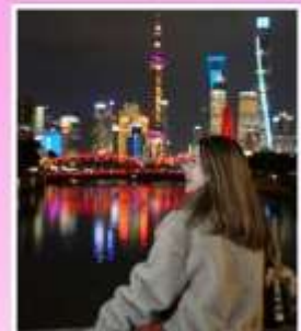
สะพานจ๋าฟู่ฉีเยอ