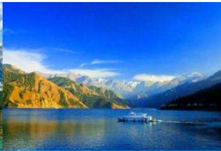
ล่องเรือทะเลสาบเทียนฉือ