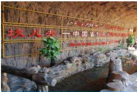
ระบบชลประทานกู๋หลู่ฟาน

พักที่ HAMPTON BY HILTON HOTEL โรงแรมระดับ 4 ดาวหรือเทียบเท่าในเมืองกู๋หลู่ฟาน