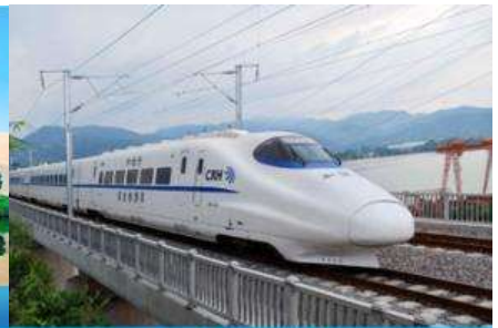
บั้งรถไฟความเร็วสูง