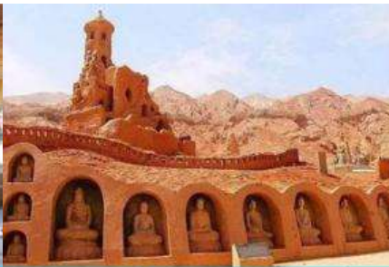
ถ้ำพระพันองค์