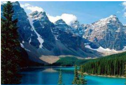
ภูเขาเทียนชาน

พักที่ MERCURE HOTEL โรงแรมระดับ 4 ดาวท้องถิ่นหรือเทียบเท่าในเมืองอูรูมูฉี