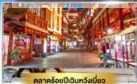
ตลาดร้อยปีเงินหวังเมี่ยว