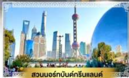
สวนนอร์ธบิ้นคังกรีนแลนด์