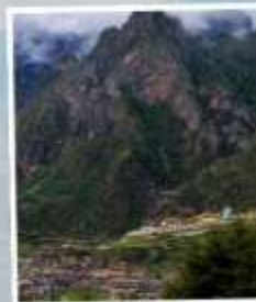
หมู่บ้านจากาน่า