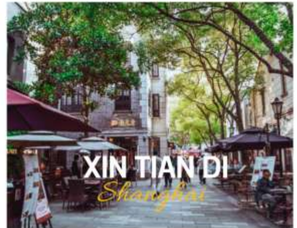
XIN TIAN DI Shanghai

ย่านใหม่ใจกลางเมืองเซี่ยงไฮ้ อีก 1 ย่านช้อปปิ้งและร้านอาหาร ร้านอาหารที่มีเอกลักษณ์ จากสถาปัตยกรรมที่ใช้อิฐบล็อกแบบสถาปัตยกรรมชิคเก๋มึน ซึ่งเป็นการผสมผสานกันระหว่างสถาปัตยกรรมจีนกับตะวันตกเข้าด้วยกัน ท่านจะพบกับทางเดินหิน กำแพงหิน ประติมากรรมที่มีเอกลักษณ์ โดย 2 ทางของถนนมีต้นเมเปิ้ลตลอดทาง ยิ่งทำให้ย่านนี้มีเสน่ห์เพิ่มเป็นเท่าตัว