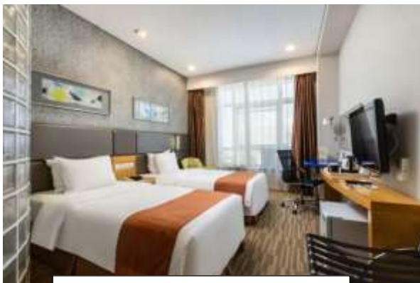
Holiday Inn Express Hotel

ที่พัก Holiday Inn Express Hotel หรือ Jinglin Hotel หรือ เทียบเท่า 4 ดาว