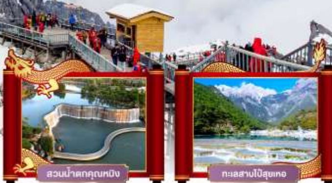
สวนน้ำตกคุนหมิง