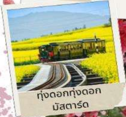
ทุ่งดอกทุ่งดอก มัสตาร์ด