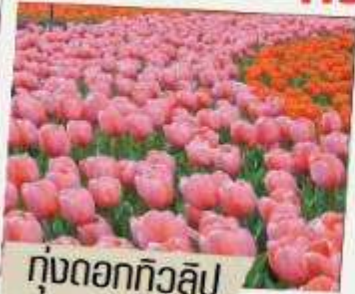
ทุ่งดอกทิวลิป