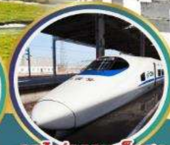
รถไฟความเร็วสูง