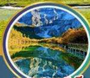
ทะเลสาบ 5 สี