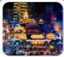
"วัดจิ่งอัน"