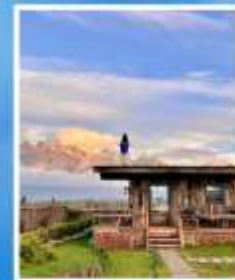
YUN DI AN CAFE