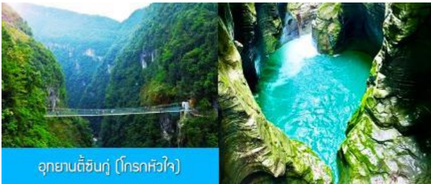
อุทยานตี้ซินกู่ (โกรกหัวใจ)

พักที่ โรงแรม ENSHI XIPU HOTEL ระดับ 4 ดาวท้องถิ่นหรือเทียบเท่าในเมืองเอินซือ