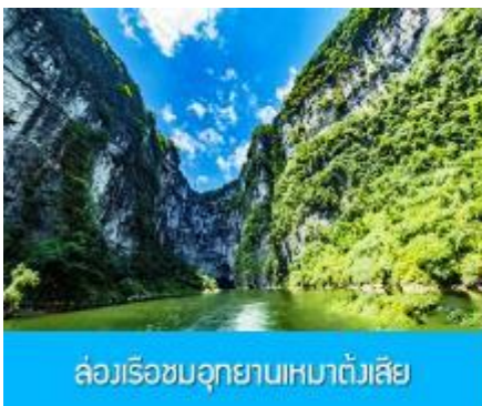
ล่องเรือชมอุทยานเหมาดังเสี่ย