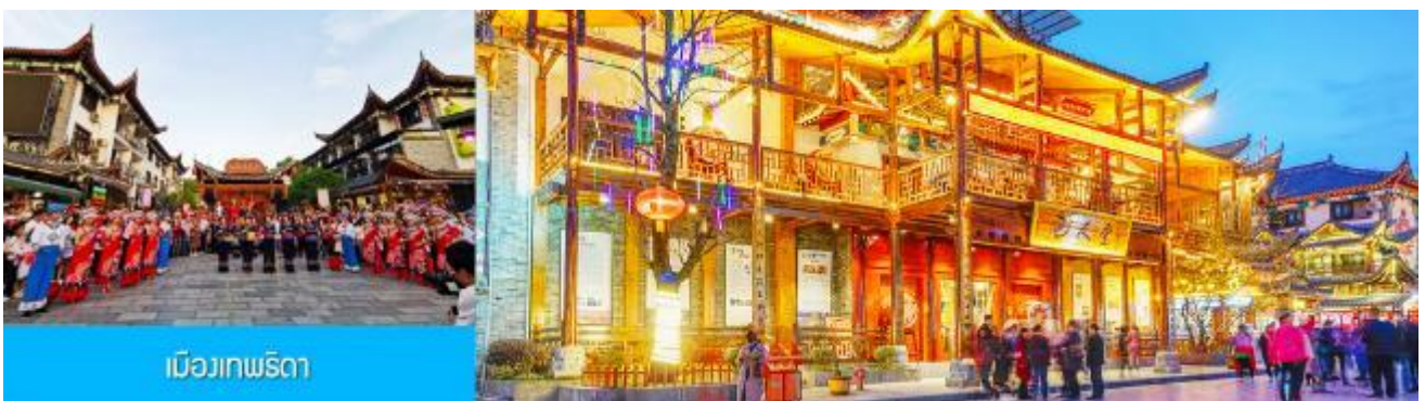
เมืองเทพริดา