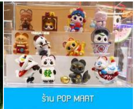
ร้าน POP MART

วันที่ห้า เมืองเอินซือ – อุทยานตี้ซินกู่ (โกรกหัวใจ) – เมืองหยีซัง – ซุปเปอร์มาร์เก็ต CBD – POP MART