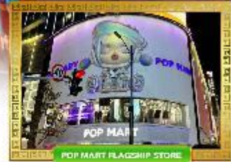
POP MART FLAGSHIP STORE