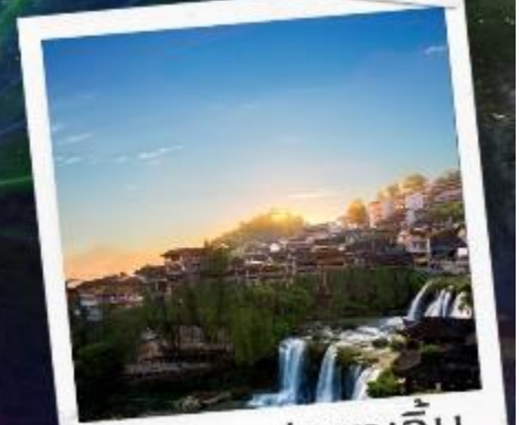
เมืองฟูรงเจิน