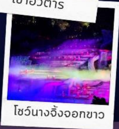
โชว์นางจิ้งจอกขาว