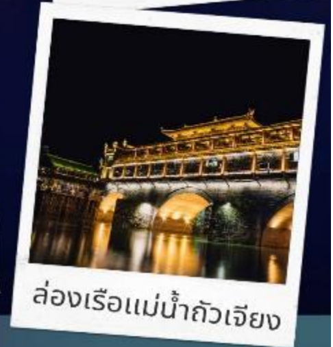
ล่องเรือแม่น้ำถั่วเจียง