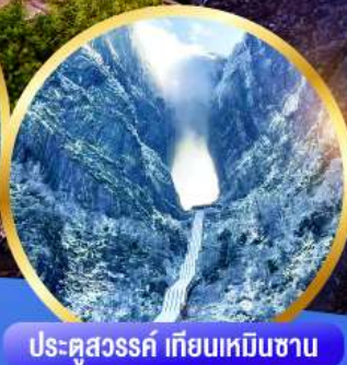
ประติมากรรม หิมะเหมินชาน