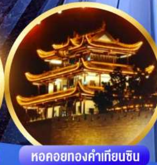
หอคอยทองคำเทียนซิน