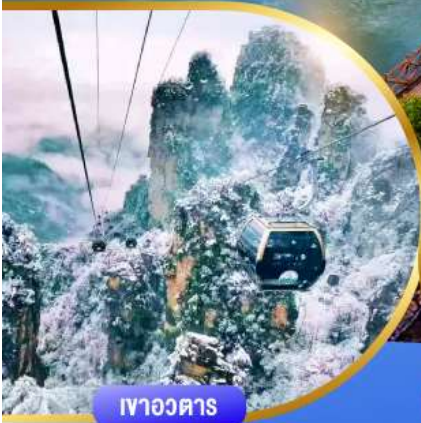
เขาวงตาร