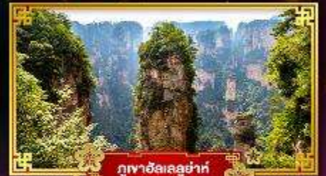
ภูผาฮัลเลอฮ่าห์