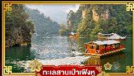
ทะเลสาบเป่าฟิ่งหู