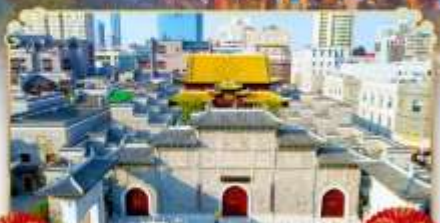
ถนนโบราณวั้งโซ่กวง