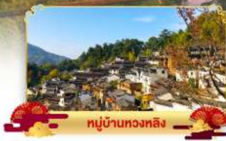
หมู่บ้านหวงหลิ่ง