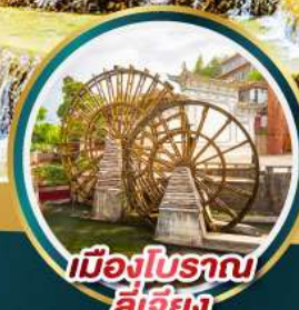
เมืองโบราณ ลี่เจียง