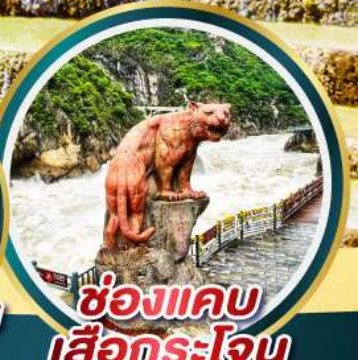
ช่องแคบ เสื่อกระโจน