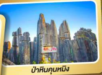
ป่าหินคุณหมิง