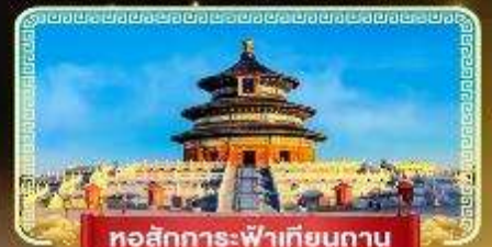
หอสังเกตการณ์เทียนถาน