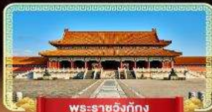
พระราชวังตงกึ่ง