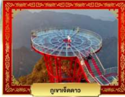
ภูเขาจิดดาว