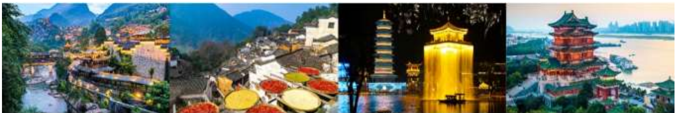
หุบเขาเทวดาฉีเจียนกู่