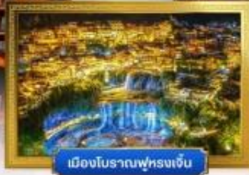
เมืองโบราณฟูหรงเจิ้น