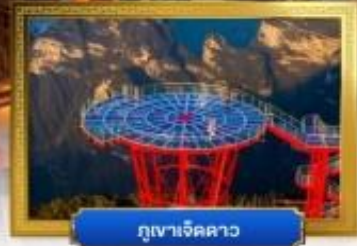
กุเขาเจ็ดดาว