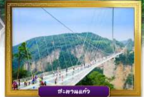
สะพานแก้ว