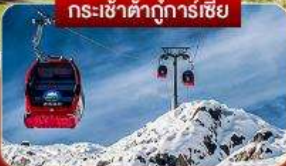
กระเช้าต้ากู่การ์เซีย