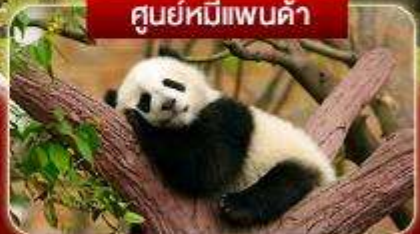
ศูนย์หมีแพนด้า

เจียงตู สัตว์ป่า หุบเขาของเอียวโกว จิวจ้ายโกว เม่าเสี้ยน กระเช้าขึ้นภูเขาสหิมะต้ากู่การ์เซีย รถไฟความเร็วสูงกลับเจียงตู แพนด้าชอฟี ไท่กู่ลี ศูนย์แพนด้า แพนด้าปิ่นตึก IFS ซุนซีลู่ ซอยกว้างแคบ ชมแสงไฟลานห้าง SKP วัดต้าอื่อ