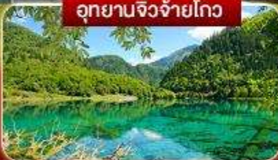
อุทยานจิวจ้ายโกว